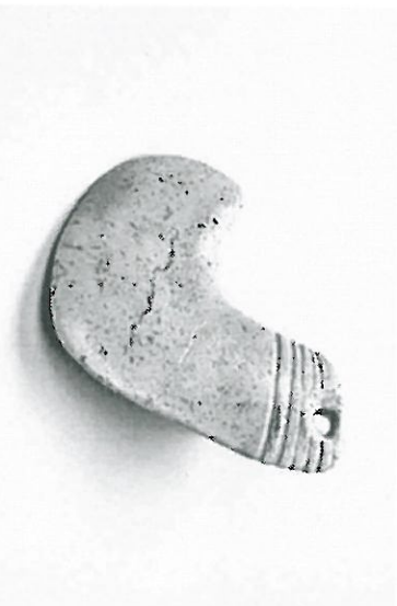
さつま町・尾竹野山遺跡(随時掲載)

丸くかわいい長靴みたいな形は、勾玉(まがたま)を意識しているのでしょうか。長い間大切に 使われたようで、あちこちすり減っています。白い蛇紋岩製です。長さ約6センチ。 (県立埋蔵文化財センター)