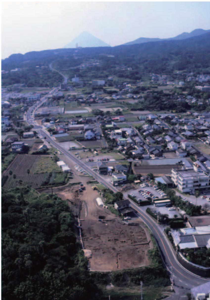
開聞岳を望む南摺ヶ浜遺跡全景

みなみすりがはま いぶすき かいもんだけ 南摺ヶ浜遺跡は、指宿市の開聞岳 と鹿児島湾に囲まれた場所に位置し た、弥生時代から古墳時代にかけて の集団墓地です。