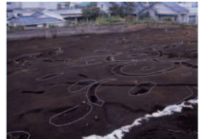
円形周溝墓・土坑墓