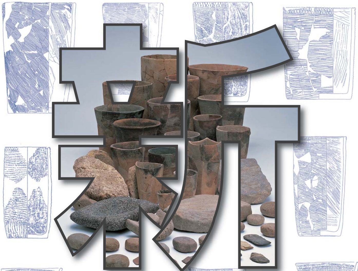
定塚遺跡出土遺物 (曾於市)