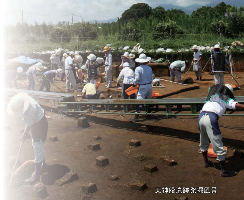
天神段遺跡発掘風景