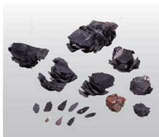
石器接合資料（宮ノ上遺跡）

完全な形に復元された多数の縄文土器や，県内初出土の銅戈， 龍の頭をかたどった珍しい水差しなど，発掘調査の最前線にふれてみませんか。