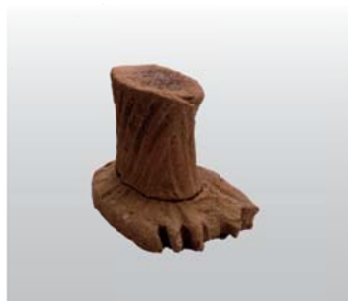
足形土製品（渡畑遺跡）