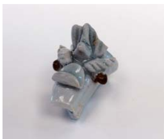
龍首水注（中郡遺跡群）