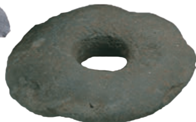
■ 環状石斧 （宮ヶ原遺跡 約 7,500 年前）