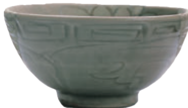
■ 青磁碗 （山仁田遺跡 約 500 年前）