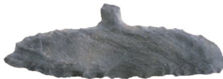
■ 石 匙（鳴野原遺跡 B 地点 約 7,500 年前）