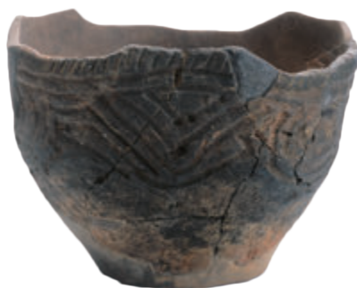
■ 縄文土器 （宮ノ上遺跡 約 4,000 年前）