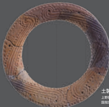
土製耳飾り 上野原遺跡（霧島市） 国指定重要文化財