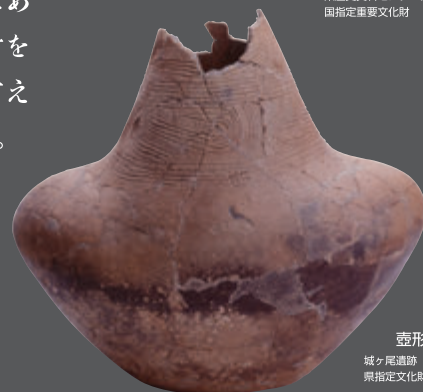
壺形土器 城ヶ尾遺跡（霧島市） 県指定文化財