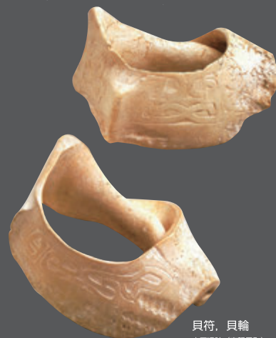
貝符、貝輪 広田遺跡（南種子町） 県歴史資料センター黎明館蔵 国指定重要文化財

今回の展示では、鹿児島県内にあ る国の重要文化財や県指定文化財を 中心に、ものづくりの原点とも言え る古代人の華麗な技を紹介します。