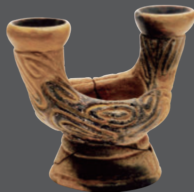
双口土器 上加世田遺跡（南さつま市）