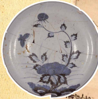
磁器 (みろく 弥勒窯跡 始良市) 始良市教育委員会蔵