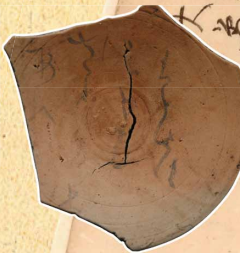
墨書土器 (けしき 霧島の杜遺跡 霧島市) 霧島市教育委員会蔵