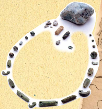
玉類 (おおつぼ 大坪遺跡 出水市)