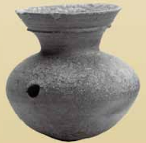
すえき 須恵器 (南摺ヶ浜遺跡 指宿市)