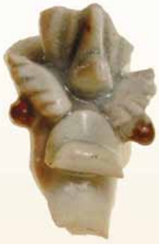
りゅうしゅすいぢゆう 龍首水注 (なかごおり 中郡遺跡 出水市)