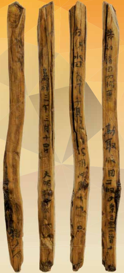
もっかん 木簡レプリカ (京田遺跡 薩摩川内市)