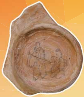
ぼくしょぎが 墨書戯画土器 (薩摩国府跡 薩摩川内市) ※レプリカ展示 (薩摩川内市川内歴史資料館蔵)