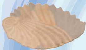
しろさつま たての ひやみず かまあと 白薩摩 [堅野(冷水)窯跡 鹿児島市]