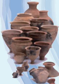
やよい たかよし 弥生土器 [高吉B遺跡 志布志市]