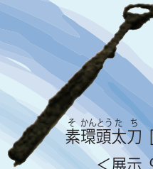
そかんとうたち たちおのほり 素環頭太刀 [立小野堀遺跡 鹿屋市]