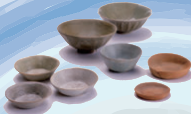
はじきわん せいじわん ぱくじ なかごおり 土師器碗、青磁碗、白磁碗 [中郡遺跡 出水市]