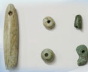
そうしやくひん せい 装飾品(ヒスイ製など) [町田堀遺跡 鹿屋市]