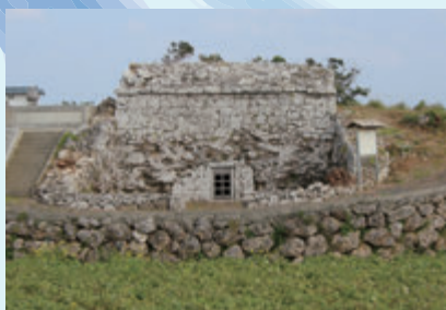
やじかりうきゅうしきふんぼ 屋者琉球式墳墓 [知名町] 知名町教育委員会蔵