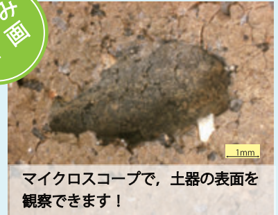
1mm マイクログラフで、土器の表面を 観察できます!