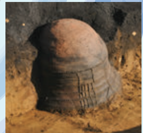
まいのう ままやま 埋納土器 [牧山遺跡 鹿屋市]