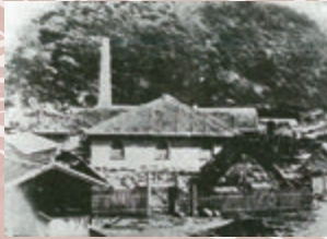
鹿児島紡績所 (尚古集成館蔵)