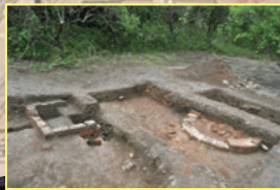
れんが積み 煉瓦積遺構 (久慈臼糖工場跡 瀬戸内町)