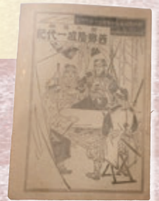
西郷隆盛一代記 (大武文庫蔵)