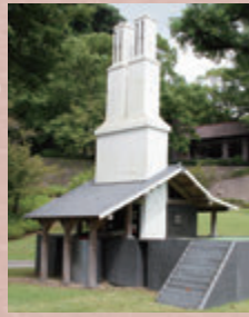
反射炉復元 (尚古集成館)