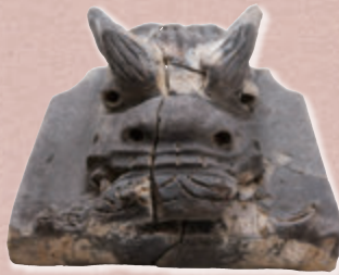
鬼瓦 (鹿児島(鶴丸)城跡 鹿児島市)