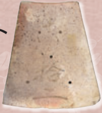
反射炉に使われた耐火煉瓦 (尚古集成館蔵)