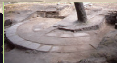
きじょう 軌条 (天保山砲台跡 鹿児島市)