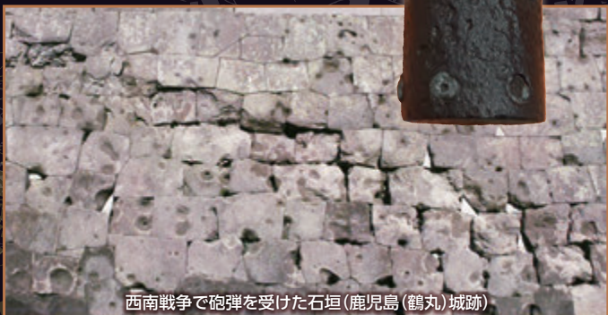
西南戦争で砲弾を受けた石垣 (鹿児島(鶴丸)城跡)