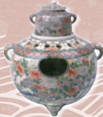
錦手秋草文丁字風炉 (鹿児島県歴史資料センター黎明館蔵) ※11月下旬から展示