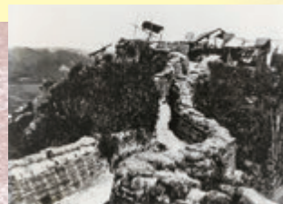
城山の陣地 [古写真]