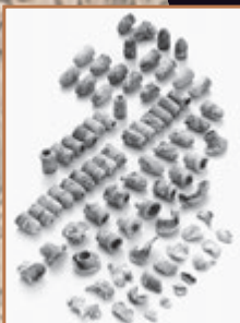
薩摩軍陣地跡出土の小銃弾 (山頭遺跡 熊本市蔵)