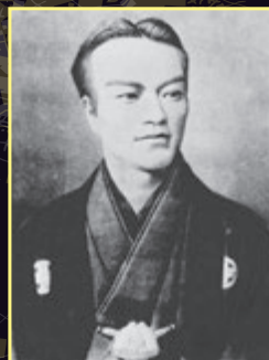
五代友厚