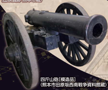
四斤山砲 [模造品] (熊本市田原坂西南戦争資料館蔵)