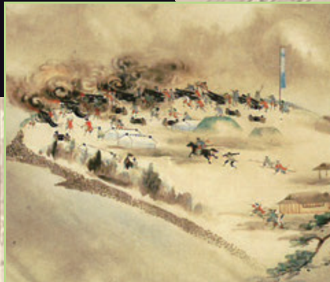
天保山砲台「薩英戦争絵巻」(尚古集成館蔵)