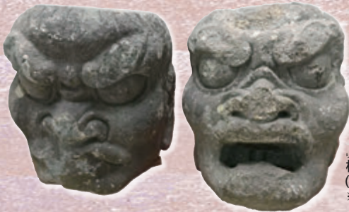
楞嚴寺の仁王像頭部 (霧島市教育委員会蔵) ※11月下旬から展示