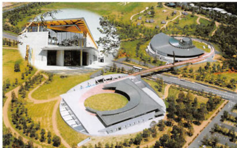
国分市上野原にオープンした「新埋蔵文化財センター」

国分市にある「上野原縄文の森」で建設が進められていた新しい鹿児島県立埋蔵文化財センターは3月に完成し、この4月から各種の業務を開始しました。