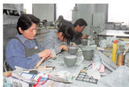
出土品整理室、実測・製図室

遺跡で出土した遺物は、水洗い後、注記・接合・復元・実測・トレース・レイアウト等の作業を経て一冊の報告書にまとめ上げられます。ここではその報告書作成のための作業を行っています。平成14年度は31か所の遺跡について整理作業が進められており、約130名の作業員が報告書作成事業に携わっています。