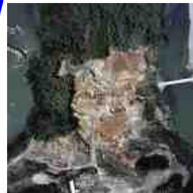
発掘調査範囲上空より撮影

平成 18 年 10 月に採択された「川内川 激甚災害対策特別緊急事業」により、本遺跡部分に分水路を建設することになりました。発掘調査は、本遺跡の記録保存を目的としています。