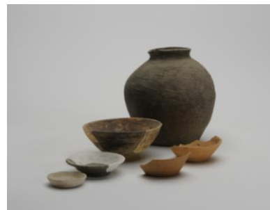
平安時代の土器の一例