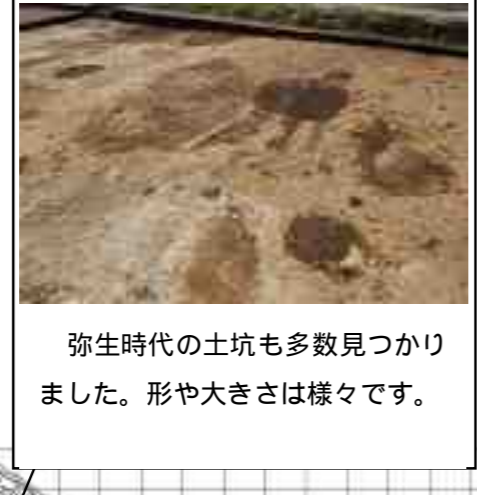
弥生時代の土坑も多数見つかりました。形や大きさは様々です。