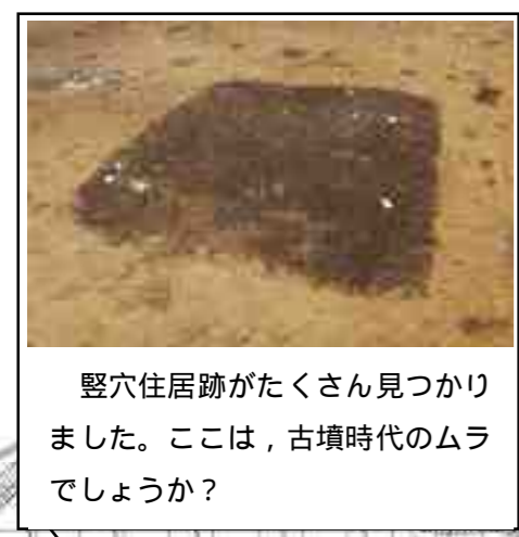
竪穴住居跡がたくさん見つかりました。ここは、古墳時代のムラでしょうか？