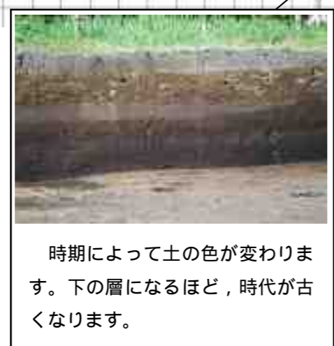
時期によって土の色が変わります。下の層になるほど、時代が古くなります。