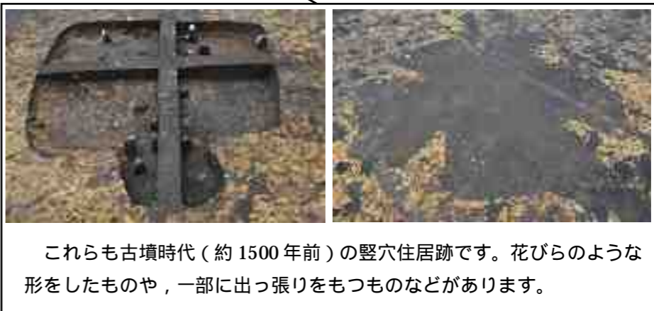
これらも古墳時代(約1500年前)の竪穴住居跡です。花びらのような形をしたものや、一部に出っ張りをもつものなどがあります。