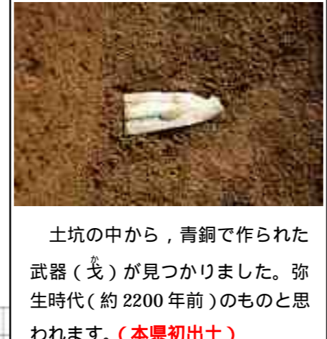
土坑の中から、青銅で作られた武器(戈)が見つかりました。弥生時代(約2200年前)のものと思われる。(本県初出土)