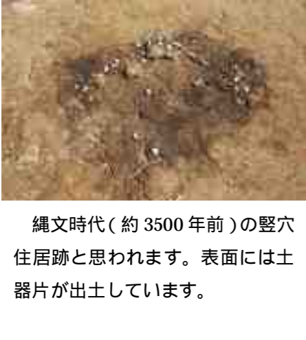
縄文時代(約3500年前)の竪穴住居跡と思われます。表面には土器片が出土しています。