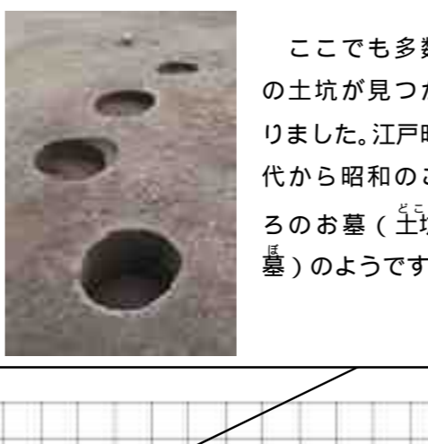
ここでも多数の土坑が見つかりました。江戸時代から昭和のころのお墓(土坑墓)のようです。