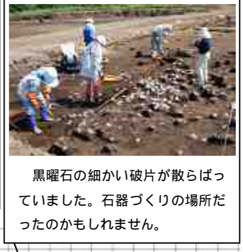
黒曜石の細かい破片が散らばっていました。石器づくりの場所だったのかもしれません。