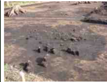
下ノ原B遺跡 (竪穴住居跡)