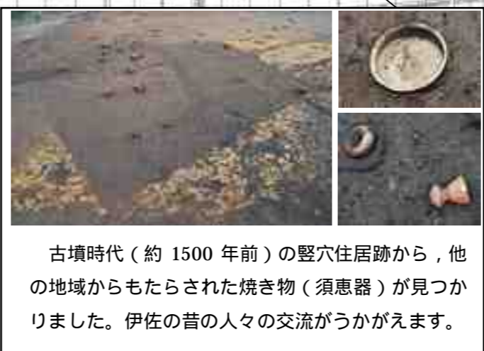
古墳時代(約1500年前)の竪穴住居跡から、他の地域からもたらされた焼き物(須恵器)が見つかりました。伊佐の昔の人々の交流がうかがえます。