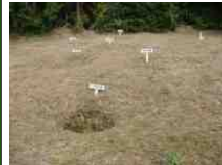
うずん 大住古墳 (地下式板石積石室)