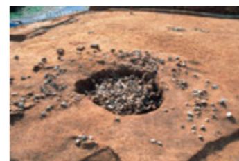
▲集石遺構(牧野遺跡:南九州市)