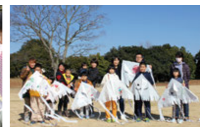
第2回 凧作りと凧揚げ大会 凧作りチャレンジ!誰が一番高く揚がるかな?