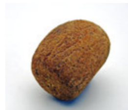
▲縄文ヴィーナス(線刻碟)