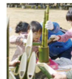
第1回 ミニ門松作り 自然の素材を使った、ステキなミニ門松で新たな年を迎えよう。