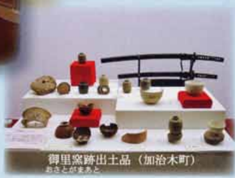
御里窯跡出土品（加治木町）