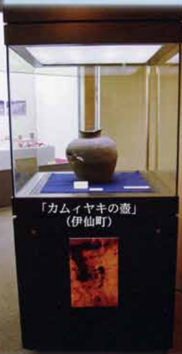
「カムイヤキの壺 （伊仙町）」