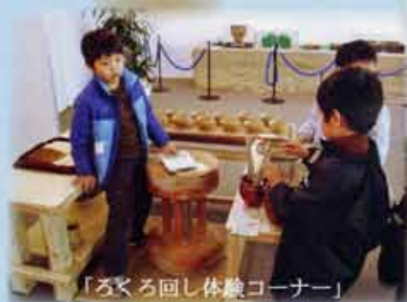
「ろくろ回し体験コーナー」