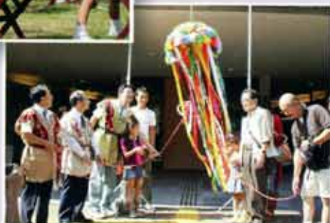
中学校社会科夏休み作品展