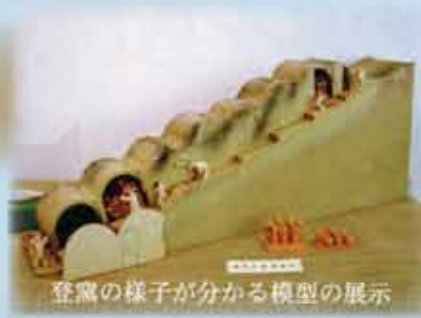
登窯の様子が分かる模型の展示