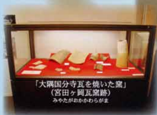
「大隅国分寺瓦を焼いた窯」