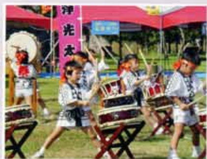
縄文の森秋まつり