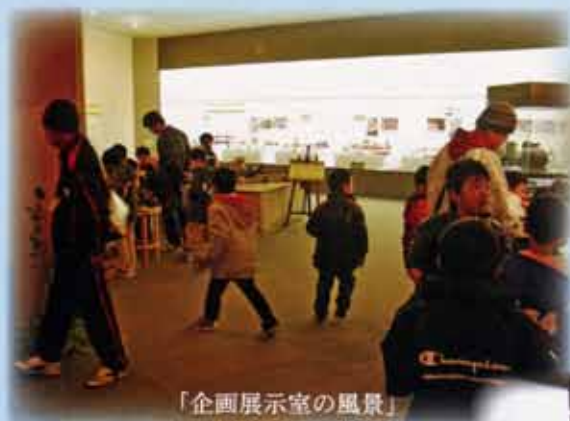
「企画展示室の風景」