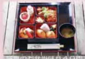
写真のお弁当は840円