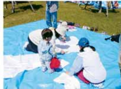
②首の部分をはさみで切り抜く。