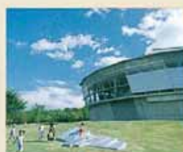
みやまコンセール 音響学の最新の成果を取り入れた国際音楽ホール。

「上野原縄文の森」周辺は、四季折々に彩りを変える霧島連山をはじめ、名湯や溪谷、史跡、アート...と、鹿児島の魅力を存分に満喫できるエリアとなっています。