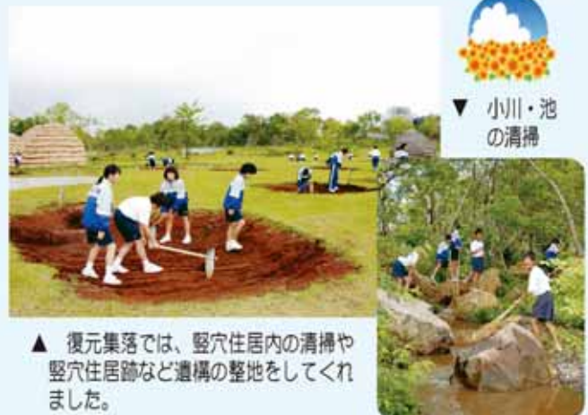
▲ 復元集落では、竪穴住居内の清掃や竪穴住居跡など遺構の整地をしてもらいました。