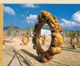
霧島アートの森 多彩な霧島の自然の中、国内外のトップアーティストの作品に囲まれる神秘的な野外美術館。