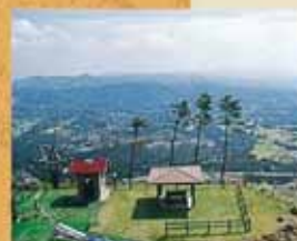
霧島神話の里公園 グラススキーやスノーパースライダーなどの施設が充実。