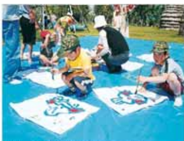
④仕上げに服に模様をつける。