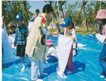
①用意した布を2つに折る。