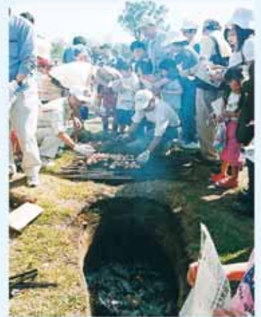
▲連穴土坑を使った「くん製卵」づくり

会員の方々は、研修会で練習を重ねた後、早速4月下旬から体験活動に参加。ゴールデンウィーク中は、復元集落での縄文食づくりの実演や体験学習館での古代体験指導に大忙しでした。