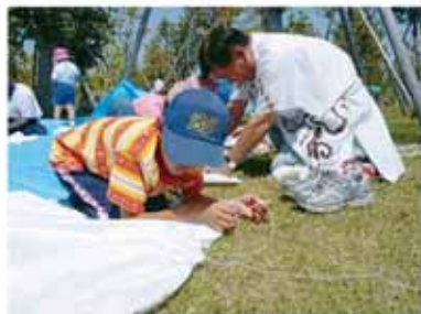
③腰の部分を竹針と麻ひもでぬう。