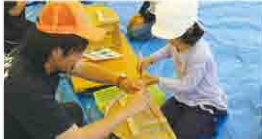
大人気の弓矢作り体験。 矢を作っている様子です。

また、まつりの目玉である火おこし大会では、参加を希望される方が多く、小学校低学年、高学年、中学生以上の3部門で激しい競争が行われ、大変盛り上がりしました。