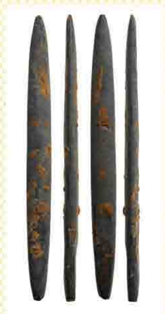
石剣4面展開写真(天神段遺跡)