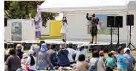
薩摩剣士集人のステージパフォーマンス。 写真撮影会、握手会もありました。