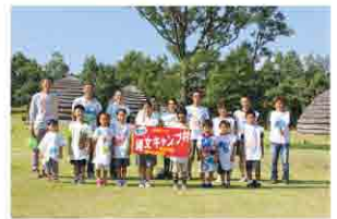
世界に1着のオリジナル縄文服 を着てパシャリ!