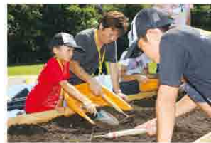
親子で疑似発掘体験!

縄文服作り、カプトムシ合戦、縄文料理、きもだめし大会、仮面作り、火まつり、竪穴住居宿泊、疑似発掘体験など、普段の生活の中では味わうことのできない貴重な体験が盛りだくさん!ご家族やお友達同士の絆が深まる、素敵なキャンプになりました。