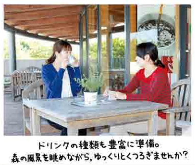
ドリンクの種類も豊富に準備。森の風景を眺めながら、ゆっくりとくつろぎませんか？

自然豊かな縄文の森に囲まれ、落ち着いた雰囲気の中で、ランチやコーヒー、お茶などを楽しむことができます。観光で疲れた体を休めていただくのに最適です。