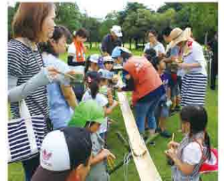
様々なイベントで、どんぐり倶楽部と一緒に料理して、食事を楽しみましょう。