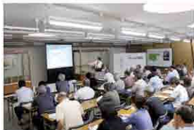
第1回考古学講座の様子

テーマは、第1回が「南九州の縄文・弥生時代」、第2回が「大隅国建国と古代隼人」、第3回が「中世山城の世界」でした。講義には、最新の発掘調査で明らかになった情報などが盛り込んであり、縄文の森ファン、考古学ファンにとって、更に、向学意欲をかき立てられる内容になったのではないかと思います。