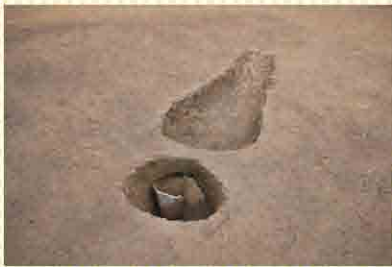
土器がそのままの形で見つかった連穴土坑(高吉B遺跡)

また、堅野(冷水)窯跡(鹿児島市)で出土した白薩摩(椀・皿)などを、期間限定(11月1日(金)～12月1日(日))で展示します。