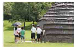
暑い中、元気いっぱい案内する 国分南中学校の皆さん