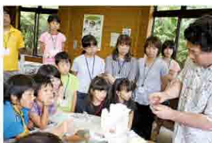
講師の説明で顔料作り

一日縄文人体験を6月22日に開催しました。第1回「縄文の彩(いろ)・顔料を作ろう」は、ペンガラや火山灰を使って、赤、黄、黒の絵の具を作り、縄文の森をイメージした絵を描いてもらいました。普段体験できないイベントで、子どもたちだけでなく、お父さん・お母さんたちも大喜びでした!