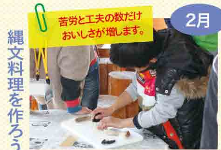
親子で協力して取り組めるのも縄文の森ならではの。