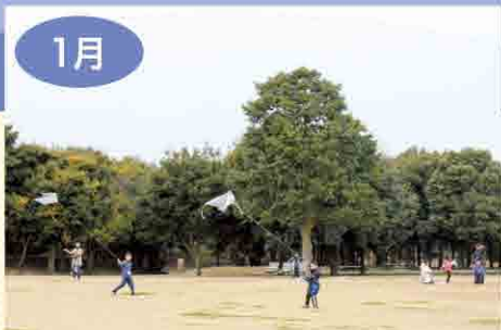
縄文の森の広い公園で思いっきり凧揚げをしよう!

9,500年前と7,500年前の上野原台地を再現した森で採れる素材を使って、縄文の森ならではの創作や体験ができます。大人から子どもまで、楽しみながらチャレンジしよう!