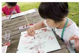
作った絵の具(顔料)で お絵かきしました。