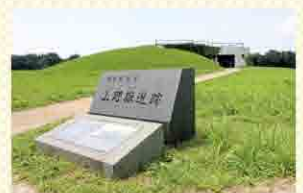
国指定史跡 上野原遺跡