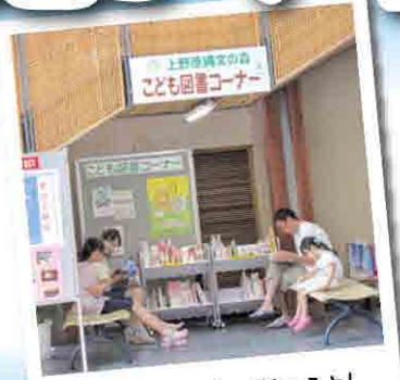
落ち着いた雰囲気を読めるよ!