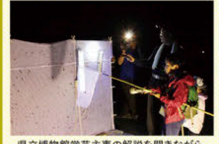
県立博物館学芸主事の解説を聞きながらの昆虫の灯火探検(平成25年7月)