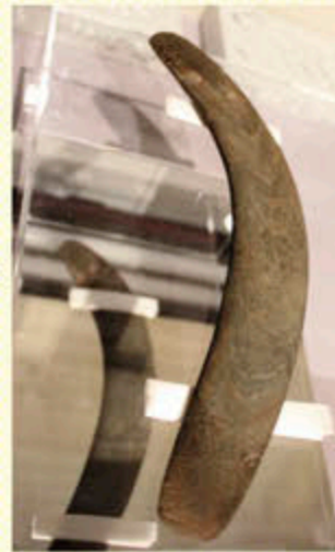
石刀(鹿屋市町田堀遺跡出土)

※講演会終了後、企画展示室にてギャラリートークがあります。(ただし、別途展示館利用料金が必要)