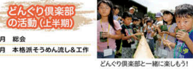
どんぐり倶楽部の活動(上半期) どんぐり倶楽部と一緒に楽しもう!

上野原縄文の森ボランティアグループ(愛称:どんぐり倶楽部)では、年間を通して様々な活動を行っています。土日・祝日は復元集落において、「上野原遺跡」についてのガイドをボランティアで行っています。秋まつり・春まつりでは、くん製肉・卵などの縄文料理や、どんぐりの粉を用いた名物「どんぐりうどん」を販売しています。いつも一期一会の気持ちでお客様とのふれあいを楽しんでいます。随時、会員を募集していますので、興味のある方は上野原縄文の森にお問い合わせください。