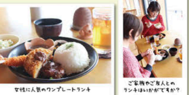
女性に人気のワンプレートランチ ご家族やご友人とのランチはいかがですか?

上野原縄文の森展示館2階にあるレストラン「フォレスタ」は、森を訪れたお客様への憩いの場として親しまれています。自然豊かな縄文の森に囲まれ、落ち着いた雰囲気の中で、ランチやコーヒー、お茶などを楽しむことができます。観光で疲れた体をお休めいただくのに最適です。