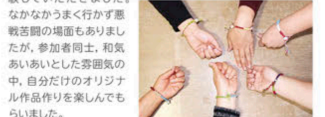
こだわりの「縄文ミサンガ」

「滑石イルカペンダント作り」「縄文ミサンガ作り」「押し花・切り絵しおり作り」「森の実ペンダント作り」の4つのメニューを体験していただきました。なかなかうまく行かず悪戦苦闘の場面もありましたが、参加者同士、和気あいあいとした雰囲気の中で、自分だけのオリジナル作品作りを楽しんでもらいました。