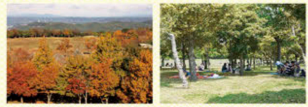
見学エリア(落葉広葉樹の森)

上野原縄文の森には、2つの森があります。ひとつはクヌギやコナラ、クリなど落葉広葉樹の森(見学エリア)。葉が薄くて広いため、春や夏には柔らかな日陰をつくり、秋には見事な紅葉、冬には枯れ葉のじゅうたんができます。もうひとつはスダジイ、アラカシ、ツバキなど照葉樹の森(体験エリア)。葉が厚くて光沢があり、日光を浴びてキラキラと輝きます。どちらも、上野原遺跡の発掘調査成果をもとに、それぞれ9,500年前、7,500年前の森を復元しています。縄文人に思いを馳せながら、のんびり過ごしてみませんか?