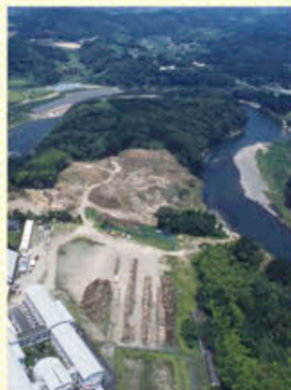
たけいし山 虎居城跡発掘風景(さつま町)

※講演会終了後、企画展示室にてギャラリートークがあります。(ただし、別途展示館利用料金が必要)