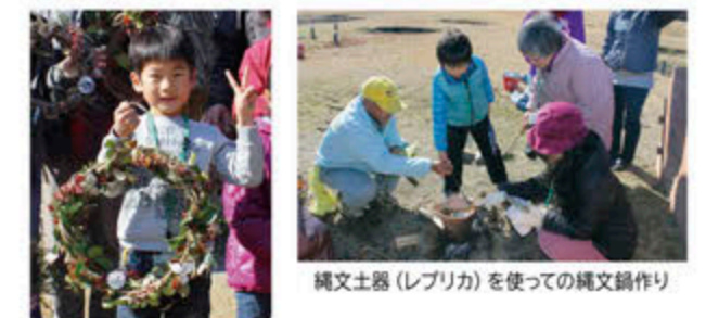
ツタや木の葉、葉っぱを使って縄文リース作り 縄文土器(レプリカ)を使っての縄文鍋作り

自然いっぱいの上野原台地の素材を使って、縄文の森ならではの創作や体験ができる「一日縄文人体験」を開催しました。リース作りやミニ門松作り、扇掛け大会、縄文料理作りなど、普段体験できないイベントに、大人から子どもまで大満足でした!