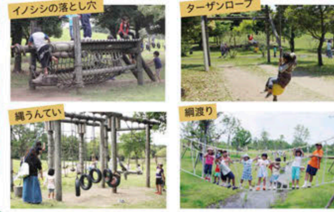
イノシシの落とし穴 ターザンロープ 縄うんてい 綱渡り

小川のほとりにたくさんある、自然木で作られたアスレチック。思いっきり体を動かそう!