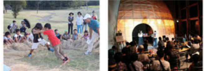
十五夜まつりのすもう大会 Duo AQUAによるフルート演奏

9月21日(土)に開催しました。どんぐり倶楽部主催の綱引きや相撲大会、団子作りなどの十五夜行事を楽しみ、夜は展示館ホール和紙ドームをバックに、Duo AQUA(デュオ アクア)のお二人による、フルートミニコンサートを行い、弓張橋のたもとから、中秋の名月の観覧会を行いました。お天気にも恵まれ、参加者の皆さんに初秋の縄文の森の魅力を思いっきりお伝えすることができました!