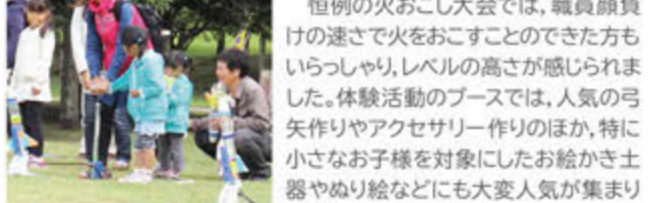
ペットボロロケット、発射準備完了!

初めての取組みとして、JR国分駅からの無料送迎バスを運行しました。また、「ペットボロロケットを飛ばそう」を実施しましたが、参加された方々からは、「予想以上に高く飛ばせることができて楽しかった。」などの声を聞くことができました。縄文の森の広い敷地を十分に活かすことのできた取組みだったように思います。