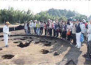
永吉天神段遺跡(曾於郡大崎町)