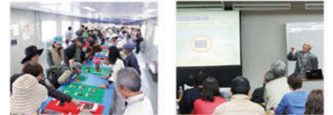
出土したばかりの遺物を観察する様子(永吉天神段遺跡) 第5回考古学講座の様子

一般の方を対象とする考古学講座を5回開催しました。テーマは、第1回「南九州の縄文・弥生時代」、第2回「大隅国建国と古代卑人」、第3回「中世山城の世界」、第4回「遺跡を見学しよう」、第5回「火山灰と考古学」でした。第4回「遺跡を見学しよう」では、上野原縄文の森での事前学習の後、発掘調査現場の永吉天神段遺跡(曾於郡大崎町)へ移動し、大昔に生きた人々の生活の痕跡を生で感じていただきました。