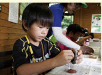
縄文時代の顔料作り(平成25年6月)