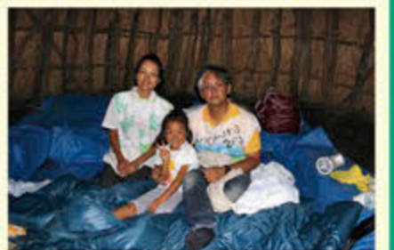
竪穴住居宿泊(平成25年8月)