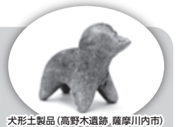
犬形土製品(高野木遺跡、薩摩川内市)