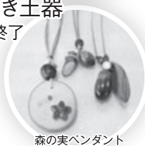
森の実ペンダント