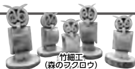
竹細工 (森のフクロウ)