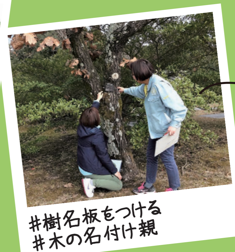
#樹名板をつける #木の名付け親