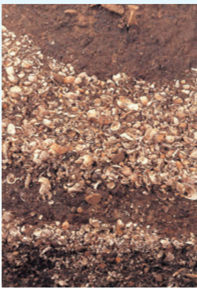
石皿と磨石(永迫平遺跡・日置市) 貝層(市来貝塚・いちき串木野市)

獲物を求めて山野を駆け巡る遊動の生活から、農耕などによる定住へ…。環境の移り変わりに適応しながら、様々な知恵と工夫で生き抜いてきた古の人々の生活ぶりを、「蘇るSHOKU」の第1弾として、「食」というテーマで紹介いたします。