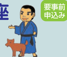
明治維新150周年関連