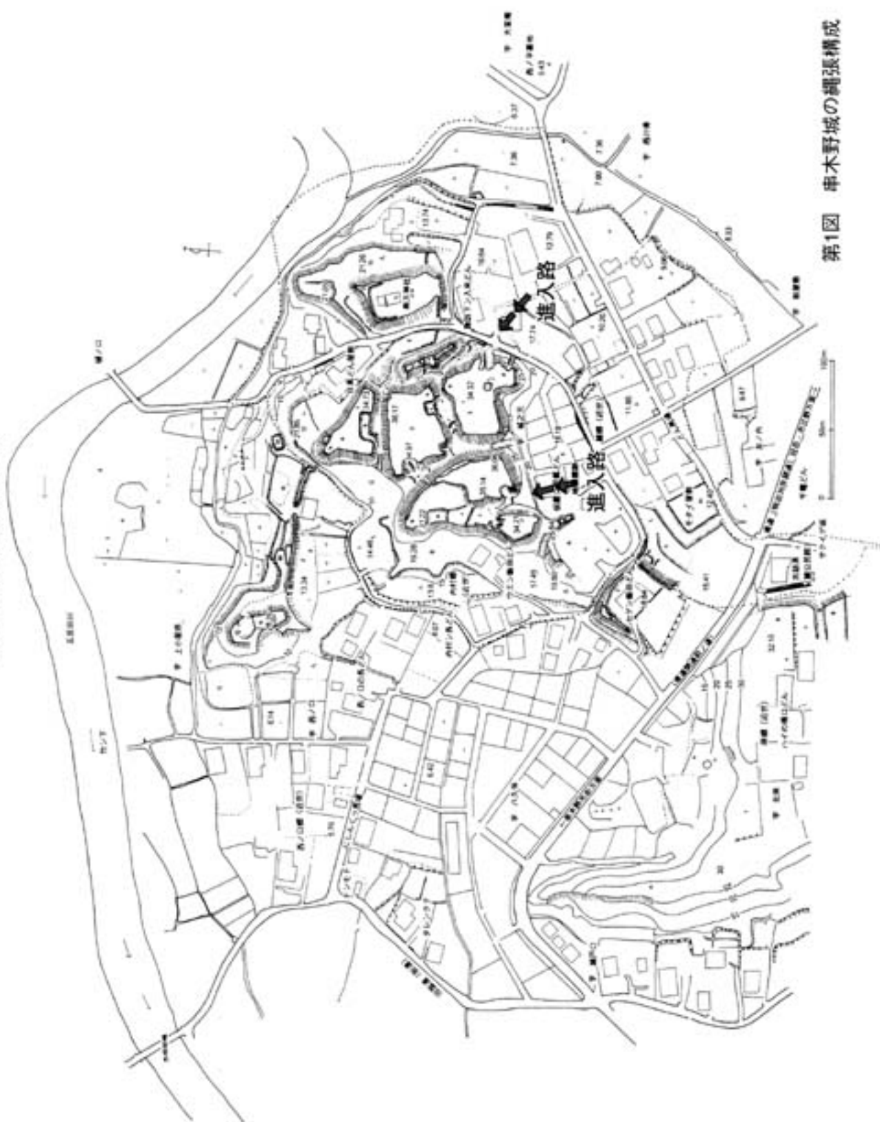
第1図 串木野城の縄張構成