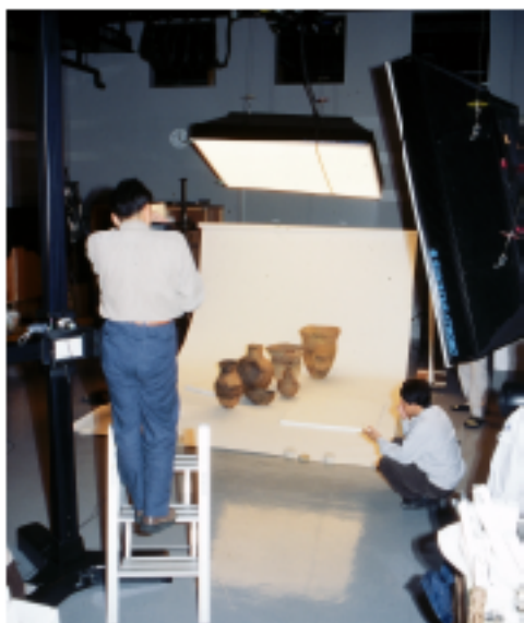
細かな条件を整えて撮影します

現在、デジタルカメラやデジタル写真がありますが、50年後、100年後も利用できるかまだ分かりません。発掘調査の写真は撮り直しができないので、フィルムに撮影し、温度と湿度が一定に保たれた部屋で保管され、将来にわたって利用されます。