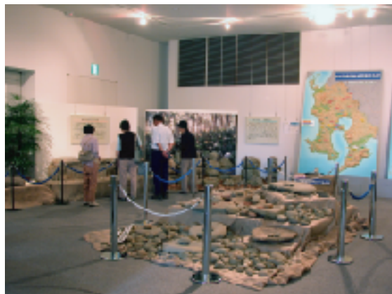
第1回 「過去から未来へ」の展示風景

「上野原縄文の森」展示館では、県内各地の遺跡で出土した遺物等の収蔵品を活用して、展示館1階の企画展示室で特別企画展を開催しています。平成14年10月5日の「上野原縄文の森」オープン以来、ほぼ3か月ごとに新しい展示を行っています。毎回のテーマごとに遺物等が身近に感じられる展示を心がけており、来館者の評判は上々のようです。展示館は毎月第1・第3月曜日は休館日となっておりますのでご注意ください。