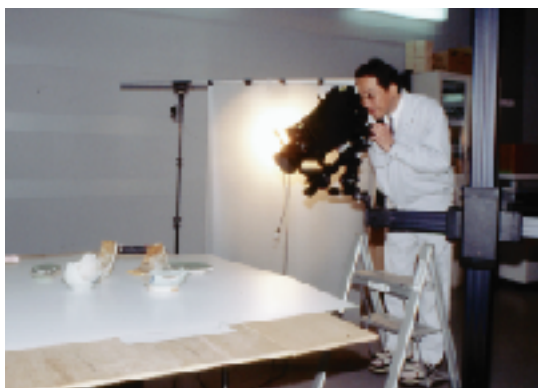
写場での遺物写真撮影の様子

遺跡の発掘調査では、出土した遺物（土器や石器など）や遺構（住居跡など）の状態を図面や写真に記録します。写真は図面では記録できない色調や材質などの質感を鮮明に記録することができます。