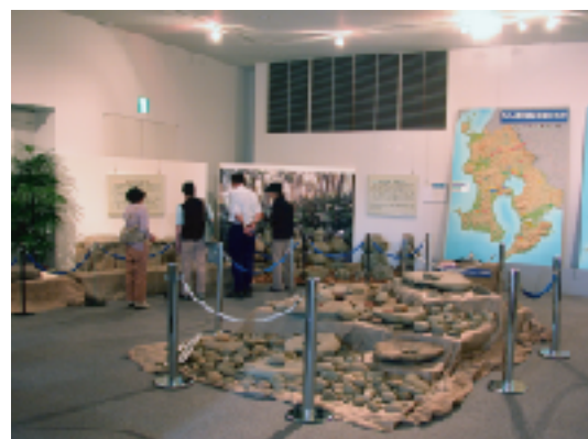
第4回 「ようこそストーンワールドへ」の展示風景