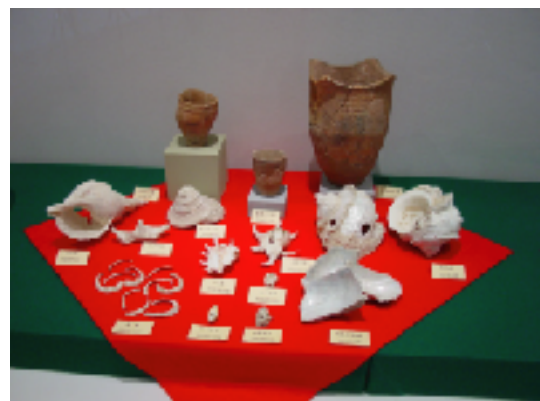
第3回 「速報展」の展示風景