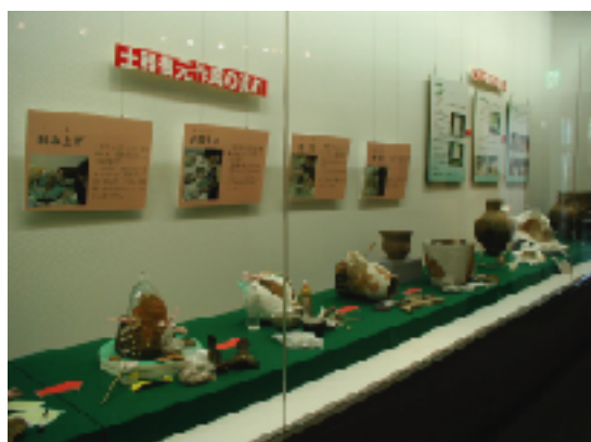
第2回 「よみがえる古代の形」の展示風景