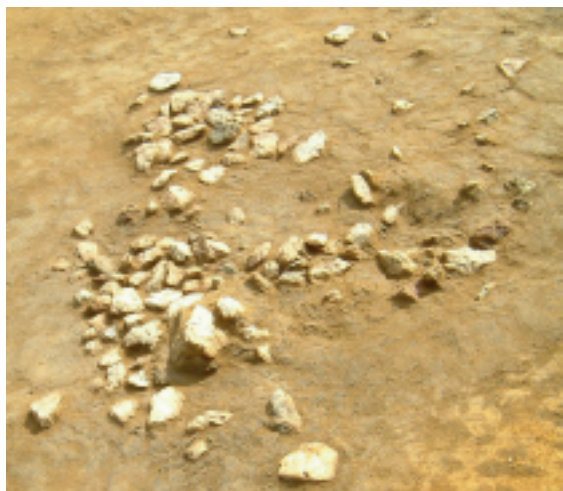
窪見ノ上遺跡 縄文時代早期集石