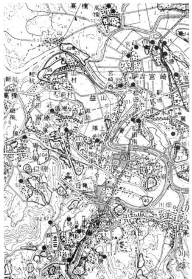
第2図 益山荘地域の遺跡 (上東・福永2000)