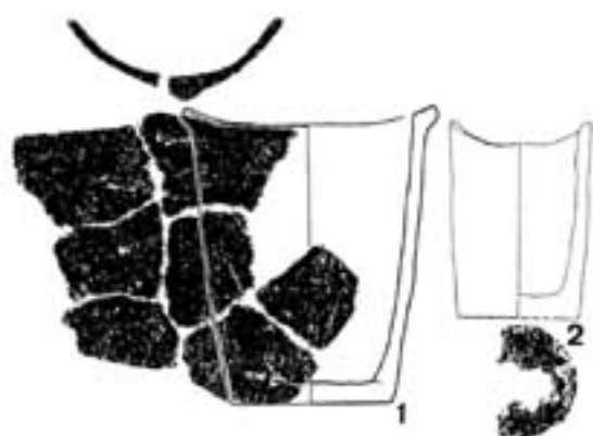
第4図 石板式土器の無文土器

迫 1993)。前迫の指摘によると、「典型的な石板式土器ともいえる古段階のもの多くは、外反する口縁部に2ないし4か所の頂部をもついわゆる山形口縁の形態を呈している。(中略)この石板式土器古段階を代表する山形口縁こそ瘤状突起の祖形ではないかと考えられる」と述べ、その初源について言及している。組み合わせという視点で石板式土器を見ると、石板式土器新段階においては、波頂部の肥厚を祖形とする瘤状突起の付くものと波頂部を有しない平口縁のものがセットとして存在している可能性も考えられるのである。また、石板式土器においてはしばしば無文土器も出土している。無文土器は、南九州貝殻文系土器においては筆者の知るところほとんど例が無く、石板式土器以前の段階では現在のところ見受けられない。石板式土器に関しての無文土器出土例(第4図)も決して多くはないが、