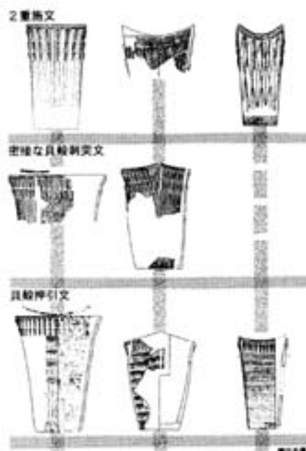
第5図 3つの器形の組み合わせ