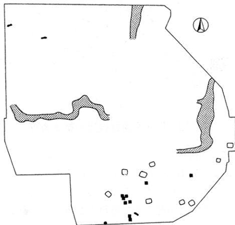
第3図 永迫平遺跡検出の道跡

それぞれの計測値は、北側の1本が幅2.6～5.2 m、傾斜角が8.5～11.1°であり、東側の道は幅が1.4～8.2 m、傾斜角は4.6～7.6°である。また、西側のものは幅が1.7～5.3 m、傾斜角は2.2～7°となっている。これから見ると、北側のものは一様に傾斜が急であるのに対して、ほかの2本の場合ははじめは緩やかであるものの、その後は急傾斜になると言えよう。