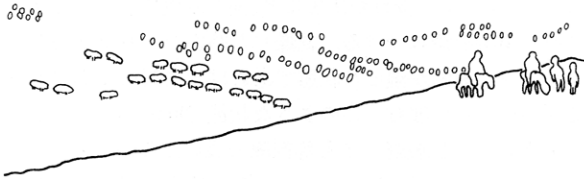
第5図 映像でみられた連続する窪み

易品となる羊の一行が列を成して歩いている背後に、連続した窪みが見える。窪みの芯々距離は羊の大きさよりも狭いことから、70cm前後が想定される。重なりながらも数条見られることから、位置を少しずつ変えながら永年使用されたことが考えられる。本来なら、現地へ出かけて調査すべきであるのだが、今のところそれもかなわない。取材スタッフに手紙で詳しいことを尋ねたのだが、返事はなかった。この連続した窪みが日本における波板状凹凸面と同一のものであるかの断定は類例を増やすしかないが、筆者は同一のものである可能性が高いと考える。