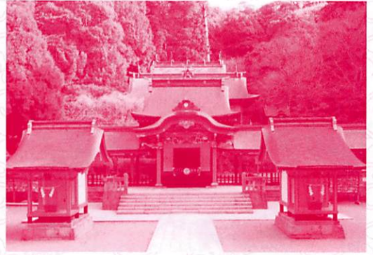
霧島神社社殿