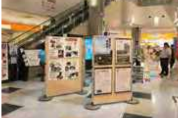
財団フェア in あいら①