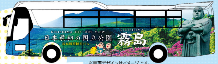
※車両デザインはイメージです。