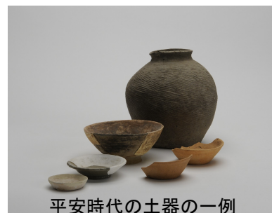
平安時代の土器の一例