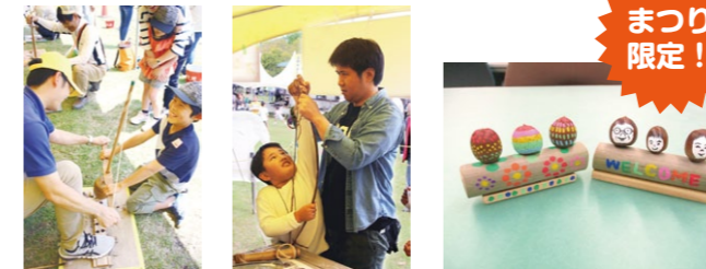
▲火おこし体験 ▲弓矢作り ▲どんぐりごまトリオ