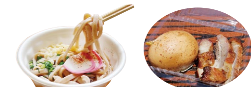
▲どんぐりうどん ▲くん製肉&卵

上野原縄文の森支援の会(愛称:どんぐり倶楽部)のみなさんが販売する「どんぐりうどん」はモチモチとした食感です。ほかにも連穴土坑で調理した「くん製肉」や「くん製卵」もあります。