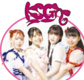
きりしまサンシャインガールズ