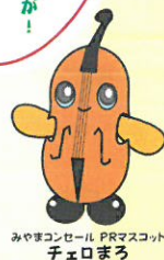
みやまコンセル PRマスコット チェロまる

みやまコンセルが！霧島アートの森が！ 上野原縄文の森が！埋蔵文化財調査センターが！ 宝山ホールに集結！