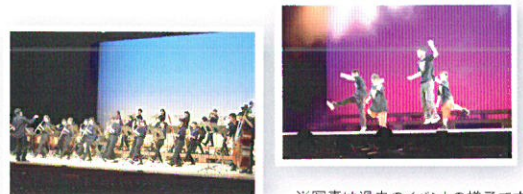
※写真は過去のイベントの様子です