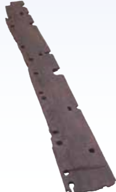
日本最古級(弥生時代)の舷側板 【中津野遺跡】(南さつま市)