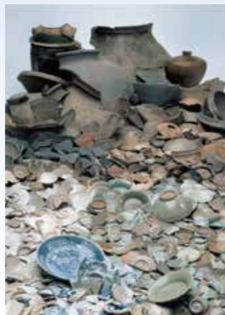
中世の貿易陶磁器が出土した芝原遺跡(南さつま市)

令和2年度に開催した「海と活きた古代人」の第2弾として、海を越えて伝わった「モノ・技術・情報」などについて、古墳時代から近世に焦点を当て関連する考古資料を紹介します。