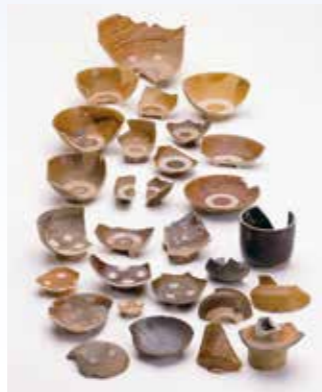
出土した江戸時代の陶器 【鹿児島城跡(火除地跡)】(鹿児島市)

令和2年度に発掘調査や整理作業を行った遺跡の中から、特に注目される遺跡を中心に、最新でホットな発掘調査成果を展示します。