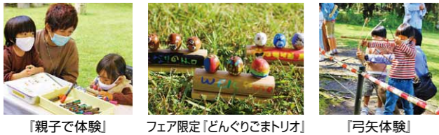
「親子で体験」 フェア限定「どんぐりごまトリオ」 「弓矢体験」

当初計画していた「第17回縄文の森秋まつり」は、新型コロナウイルスの影響で開催が困難となり中止が濃厚になっていました。そんな中、職員の中に、縄文の森を愛して下さるお客様に少しでも楽しんでいただき元気を取り戻してほしいという気持ちが芽生えてきました。協議に協議を重ね、どのように安全を確保すればよいか、知恵を絞った結果、「縄文体験フェア」として実施することにしました。秋まつりに比べて規模は小さくなったものの、手指の消毒やマスク着用など、十分な感染防止対策をとってフェア限定など、6種類の体験活動を行いました。お客様が笑顔で体験されている様子に、喜びを感じることができました。