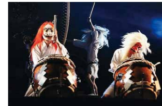
霧島九面太鼓保存会