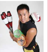
ジャグラーひがちゅう