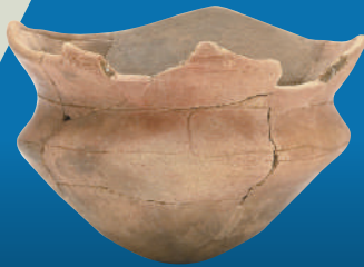
さんさもん 三叉文を施文し赤く塗られた土器 (石鉢谷B遺跡: 鹿屋市)