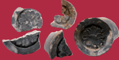
牡丹文丸瓦 (鹿児島城跡 (犬追物馬場・火除地)：鹿児島市)