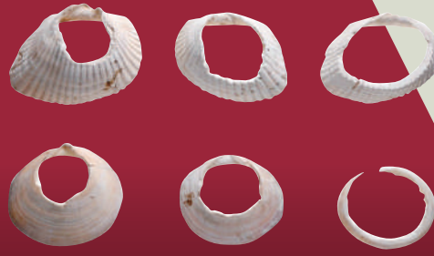
貝製品・貝輪(市来貝塚: いちき串木野市) 【河ロコレクション】