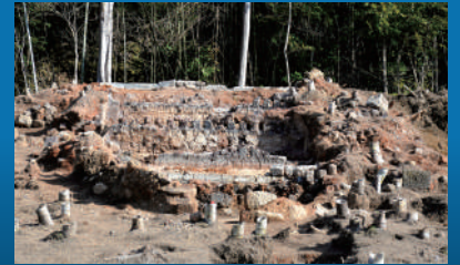
扇形連房式登窯跡 (平佐焼窯跡群: 薩摩川内市)