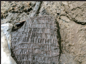
縄文時代の編みかご (前田遺跡: 始良市) 始良市教育委員会