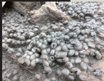
縄文時代のドングリの貯蔵場 (前田遺跡: 始良市) 始良市教育委員会