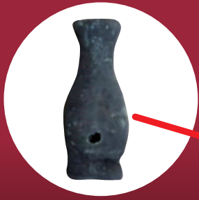
華瓶(けびょう) (照信院跡: 曾於郡大崎町)