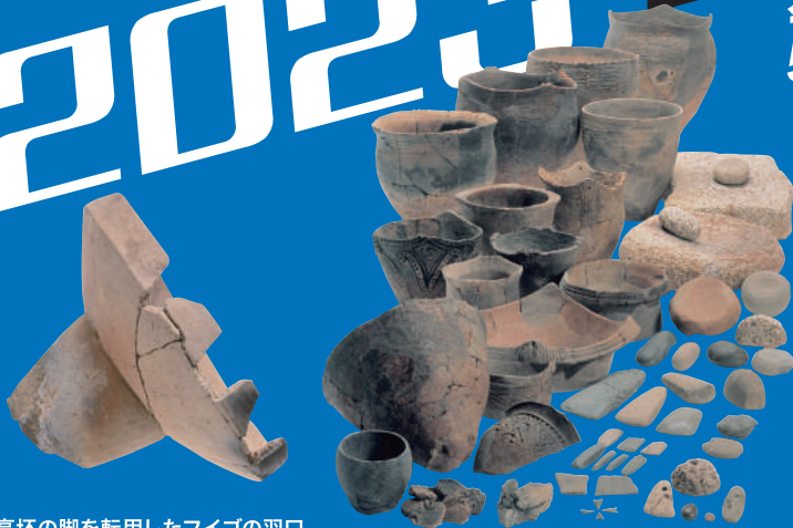
高坏の脚を転用したフィゴの羽口 (川久保遺跡：鹿屋市)