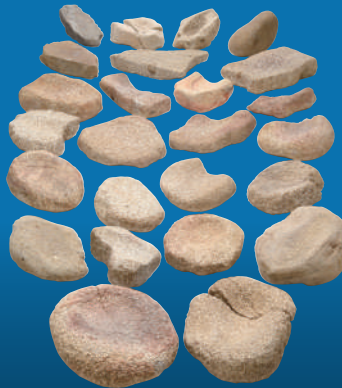
石皿(小牧遺跡: 鹿屋市)