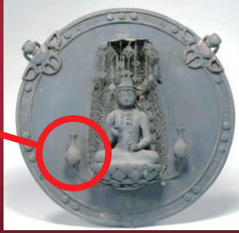
聖観音懸仏(鏡板径45.5cm 像高21.0cm)重要文化財