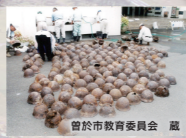
曾於高校(曾於市)で出土した鉄帽【太平洋戦争】