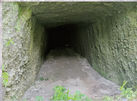
大窪地区(霧島市)の戦車壕【太平洋戦争】