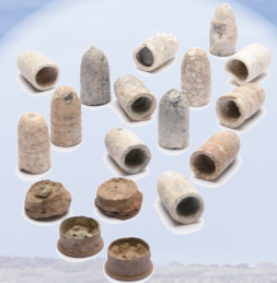
高熊山(伊佐市)で出土した銃弾・薬きょう【西南戦争】

今年太平洋戦争終結80年にあたります。県内でも戦争関連遺跡の発掘調査が行われてきており、各時代の様々な戦跡や遺構・遺物が発見されています。今回の企画展は、太平洋戦争や西南戦争に関わる遺跡・遺物を中心に展示を行います。併せて、弥生時代・古墳時代の武具系の遺物などの発掘調査成果も展示し、各時代の“たたかい”の歴史について紹介します。