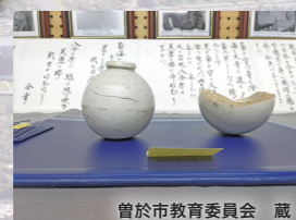
大隈町志柄牧(曾於市)で出土した陶磁器製手榴弾【太平洋戦争】